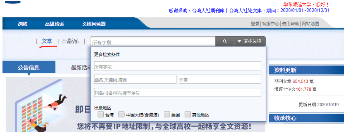
图 1 文章检索