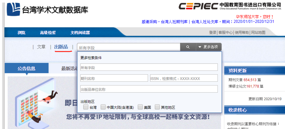
图 2 出版品检索