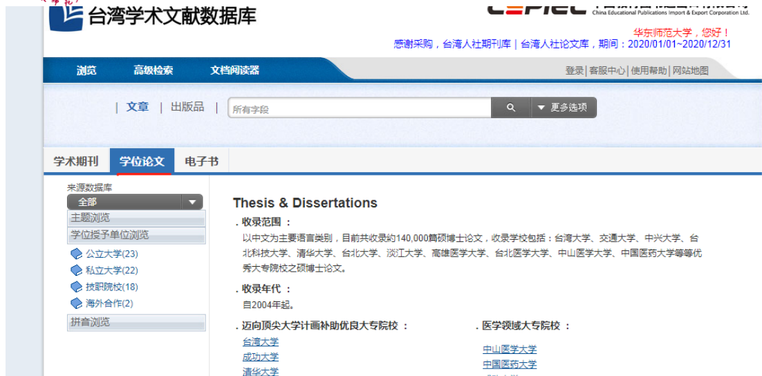
图 5 学位论文浏览