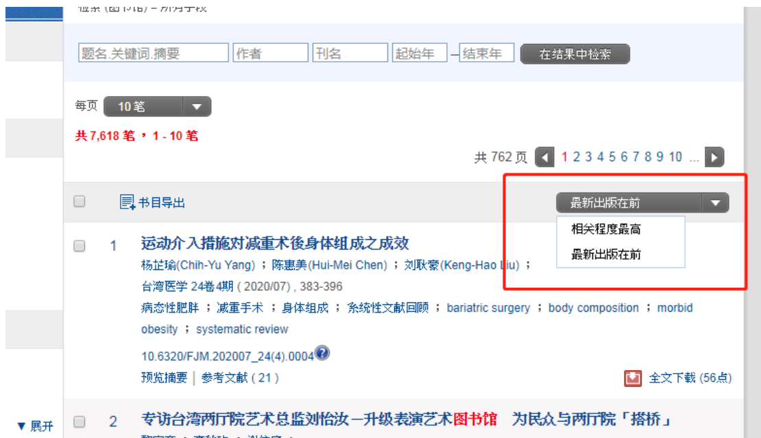
图10 选择最新出版在前的文献