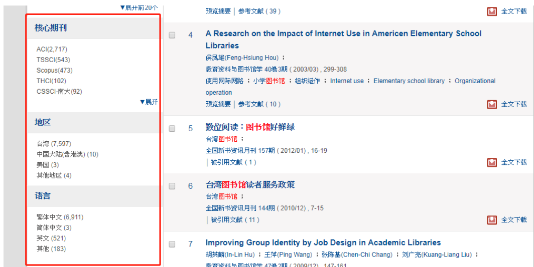
图8 按核心期刊、地区等对结果进行分类