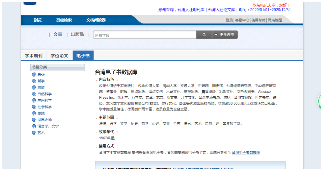
图 6 电子书浏览