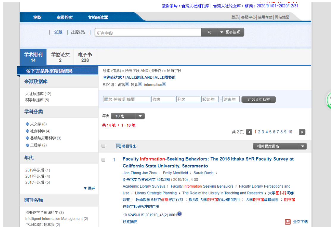
图 12 案例检索