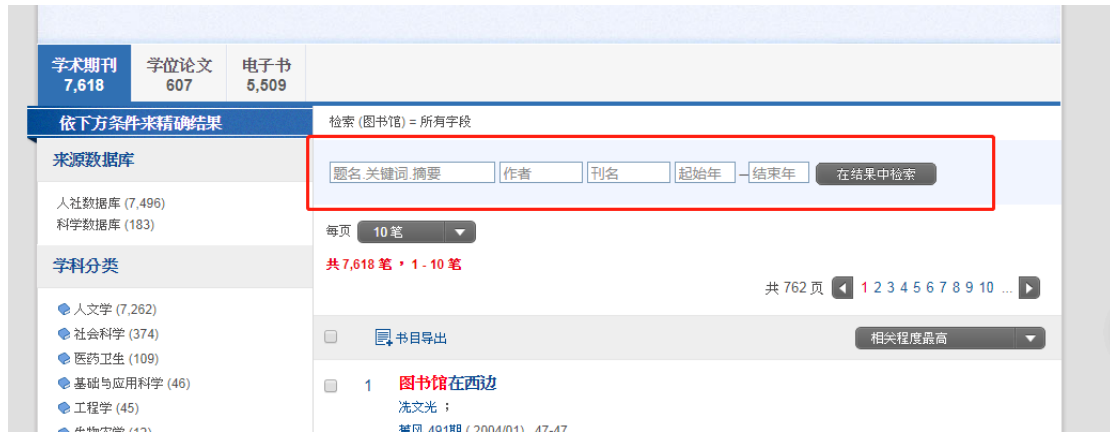
图9 在结果中检索、逐步优化