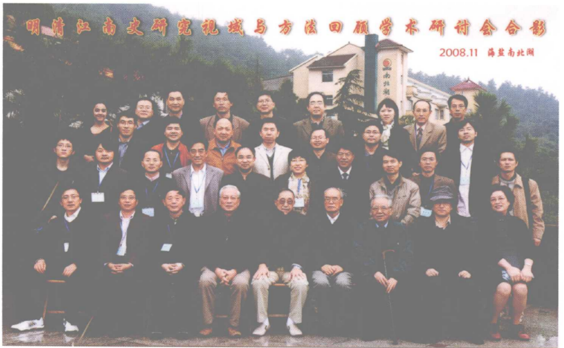
明清江南史研究视域与方法回顾学术研讨会全体与会代表合影留念